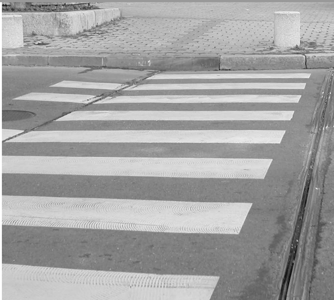
Un trottoir peut s'avérer être une barrière infranchissable

J'habite dans une institution genevoise. Pour me rendre à mon travail, j'utilise les transports spécialisés. Pour mes loisirs, je dispose de la voiture de ma famille et d'un vaste réseau de connaissances qui me véhiculent bénévolement.