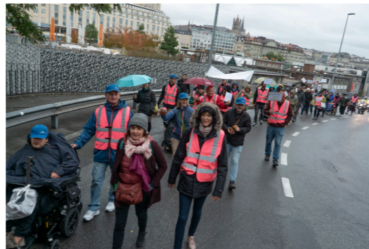
Marche « rien sur nous sans nous » à Lausanne

Cap-Contact s'est réjouie de vivre cette expérience avec ses partenaires de faitière: Solidarité Handicap mental et Antenne Handicap.