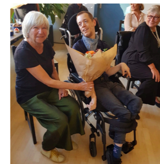
Passage de témoin au comité

J'ai rejoint le comité de Cap-Contact en juin 2023. Ce qui m'a convaincu chez CC, ce sont son engagement et sa militance pas comme les autres. Je m'y consacre depuis avec détermination.