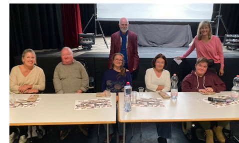
Intervenants de la table-ronde :